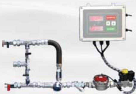
3 WAY KIT in DOX 25M